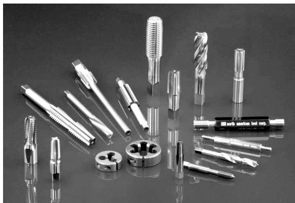
“Werkzeuge von Weltklasse-Qualität durch engagierte Teamarbeit.”™