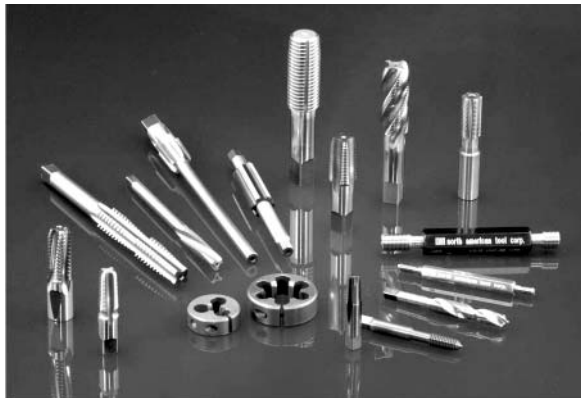
"Dụng cụ tâm cỡ thế giới với quyết tâm làm việc trên tinh thần đồng đội."™