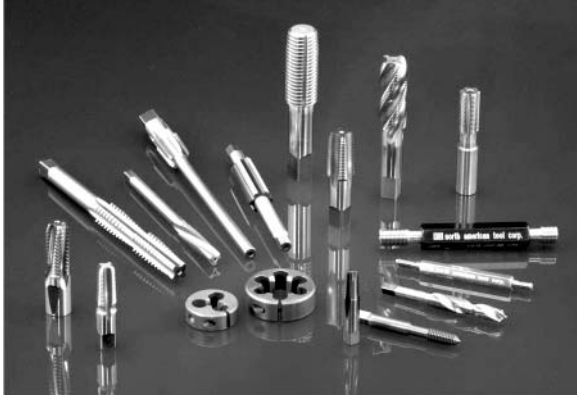
“ 탭의 혁신을 통한 세계 일류의 공구. ” TM